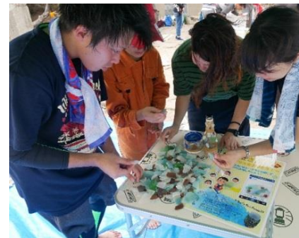
きれいなシーグラスを選び中

○シーグラスとは？ 海岸で見つかるガラス片のこと。 ガラス片が長い間波に揉まれる ことで、表面は曇りガラスのよう になり、丸みを帯びた形へと変 化していきます。