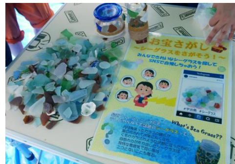
宇治島で集めたシーグラス