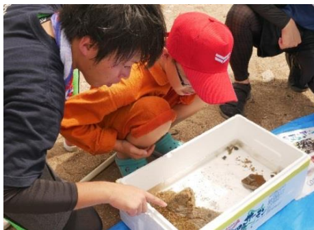
宇治島に生息する海の生き物を観察する様子