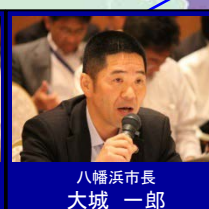
八幡浜市長 大城 一郎