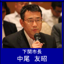
下関市長 中尾 友昭