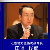
近畿地方整備局副局長 田邊 俊郎