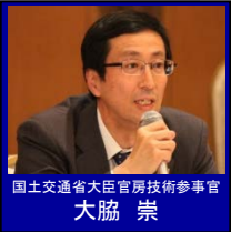
国土交通省大臣官房技術参事官 大脇 崇