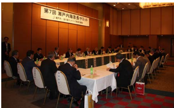
首長サミットの様子

平成24年3月29日に28市町村により「瀬戸内・海の路ネットワーク災害時相互応援に関する協定」が締結され、平成25年5月22日現在では53会員により協定が締結されています。また、協定運営協議会・防災委員会において災害時総合支援に関する具体的な取組が検討され、担当者リストの作成、災害時に供給可能な資機材・物資のリスト作成を行い、今後、情報伝達訓練や基礎的防災訓練（机上訓練等）を実施することが提案