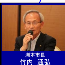
洲本市長 竹内 通弘