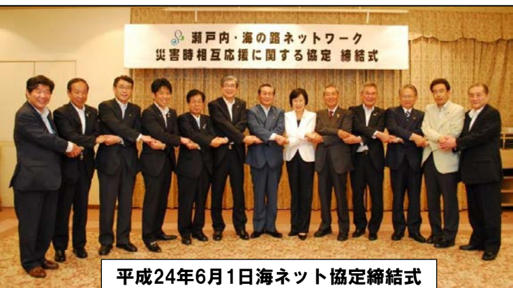
平成24年6月1日海ネット協定締結式

第12条 海ネット共助会員は、 平素より相互に海の路を介した交流・連携の推進を図りつつ、協定の実効性の確保に努める ものとする。