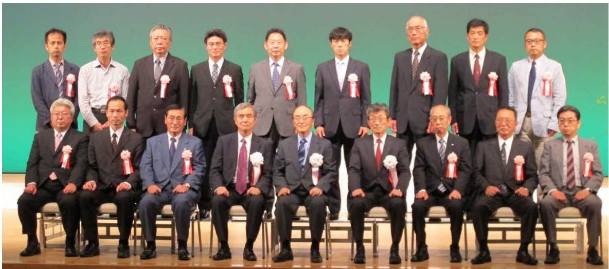
記念撮影の様子 (前列左より3番目 入山欣郎 大竹市長)