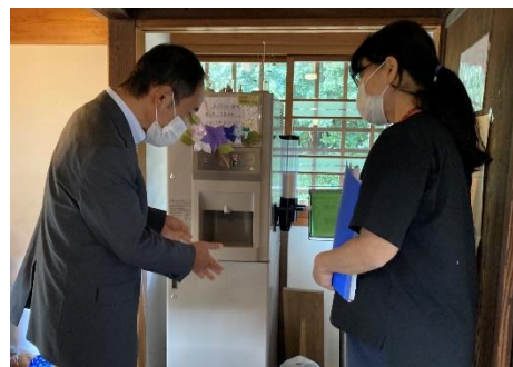
▲高松氏による指導の様子