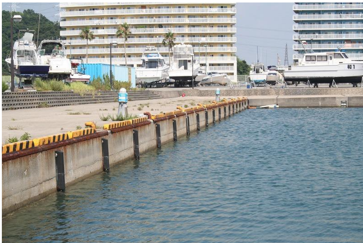
ディングーヤード